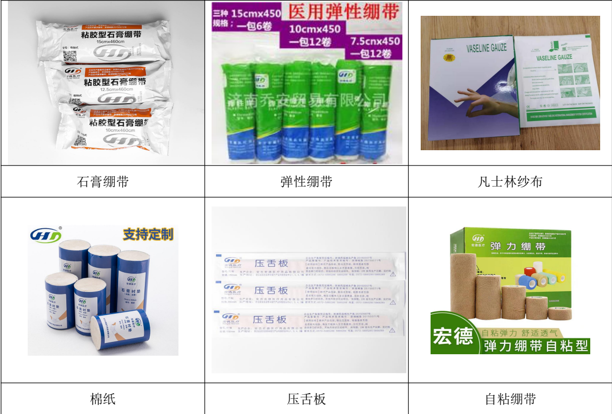
图表 2 产品图册

宏德在多年的发展实践中，始终将企业文化作为发展的支撑点和指导思想，以“诚信、务实、创新、奉献、关爱残疾人”的核心价值观，围绕企业发展壮大，逐步构建了企业使命、愿景、价值观等方面独特的企业文化。企业文化作为一种精神资源，不断推动公司持续前行。