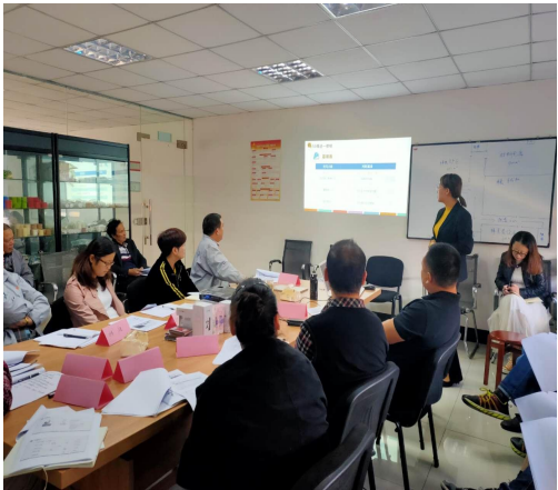
现场 5S 管理与卓越绩效管理培训