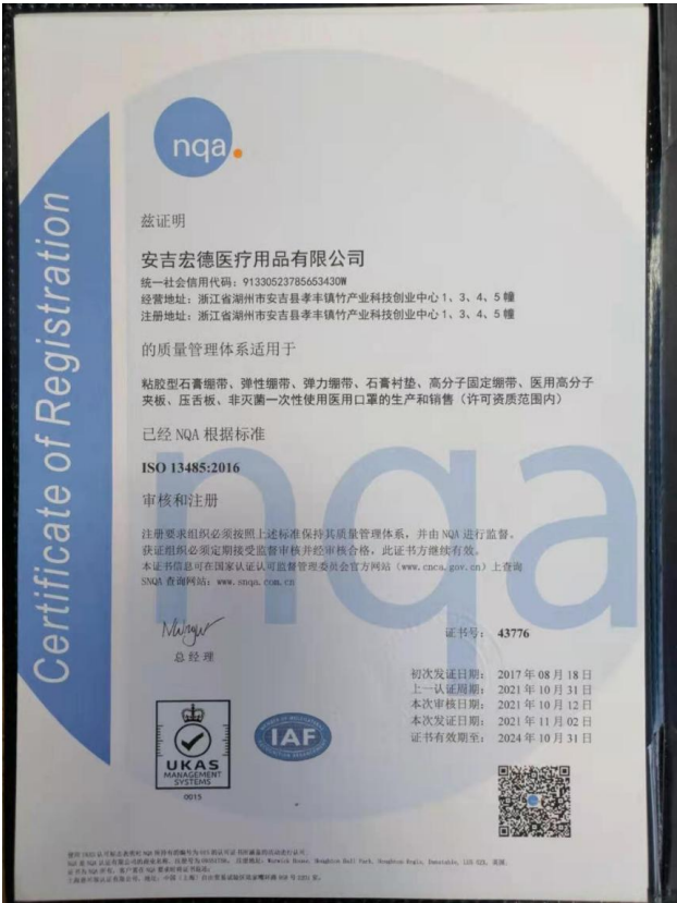
图表 1 体系认证证书

围绕顾客对产品和服务的需求，宏德以新产品开发、提高产品品质和服务水平为主要手段，在技术、设备设施方面，通过持续的创新和技术提升，为顾客提供优质的产品和服务，使顾客更具竞争力，同时使宏德得到快速发展，并逐步形成了粘胶型石膏绷带、弹力绷带、石膏衬垫、高分子固定绷带、医用高分子夹板、压舌板、弹性绷带、凡士林纱布等产品。